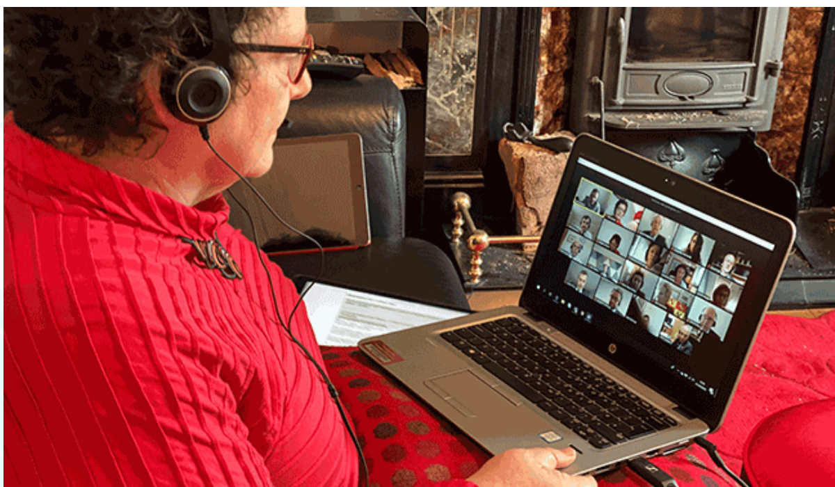
Y Llywydd Elin Jones AS yn cadeirio cyfarfod Zoom]

Eleni, mae Comisiwn y Senedd wedi gwneud gwaith arloesol o ran dwyieithrwydd a'r defnydd o dechnoleg yn ystod pandemig Covid-19. Er mwyn sicrhau bod Aelodau yn gallu parhau â'r gwaith hollbwysig o graffu ar ddeddfwriaeth a dal Llywodraeth Cymru i gyfrif ar adeg pan nad oedd modd iddynt fod yn bresennol yn y Senedd, roedd angen cymryd camau brys. Ymchwiliodd staff i'r dechnoleg oedd ar gael i gynnal cyfarfodydd ar-lein ar gyfer nifer fawr o bobl, a hynny yn ddwyieithog. Penderfynwyd defnyddio meddalwedd Zoom. Ar 1 Ebrill 2020 cynhaliwyd cyfarfod rhithiol cyntaf y Senedd Frys a hynny yn gwbl ddwyieithog. Mae'r Senedd wedi derbyn llawer o glod yn genedlaethol ac yn rhyngwladol, ac rydym wrthi bellach yn cynghori sawl corff cyhoeddus ac awdurdodau lleol ynghylch cynnal cyfarfodydd rhithiol gan ddefnyddio cyfieithu ar y pryd.