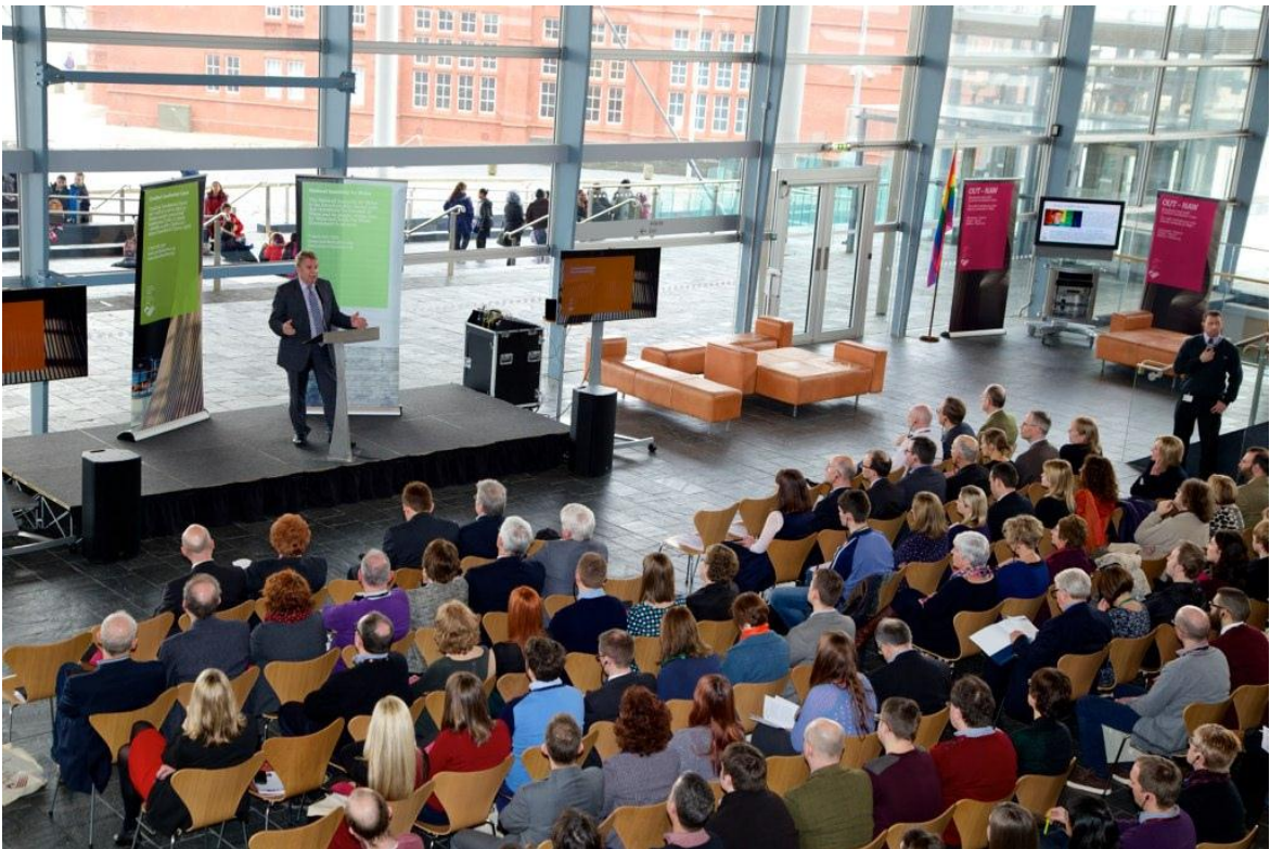
Lansiwyd cyfleuster byd-eang y Gymraeg ar gyfer Microsoft Translator yn y Senedd ar 21 Chwefror 2014, sy'n galluogi defnyddwyr Microsoft ledled y byd i gyfieithu testun i'r Gymraeg ac o'r Gymraeg.