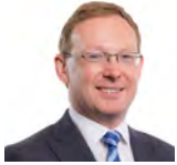
Russell George AC (Cadeirydd) Ceidwadwyr Cymreig Sir Drefaldwyn