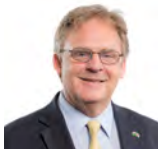
Mark Isherwood AC Ceidwadwyr Cymreig Gogledd Cymru