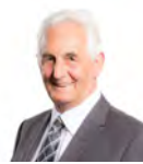
David J Rowlands AC UKIP Cymru Dwyrain De Cymru