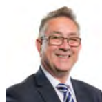
Mick Antoniw AC Llafur Cymru Pontypridd