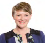
Bethan Sayed AC Plaid Cymru Gorllewin De Cymru