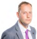
Gareth Bennett AC UKIP Cymru Canol De Cymru