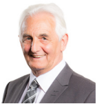
David J Rowlands AC UKIP Cymru Dwyrain De Cymru