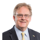
Mark Isherwood AC Ceidwadwyr Cymreig Gogledd Cymru