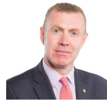
Adam Price AC Plaid Cymru Dwyrain Caerfyrddin a Dinefwr