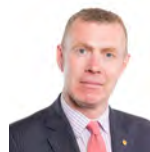
Adam Price AC Plaid Cymru Dwyrain Caerfyrddin a Dinefwr