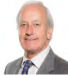
Neil Hamilton AC UKIP Cymru Canolbarth a Gorllewin Cymru