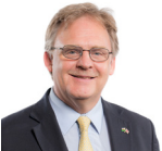
Mark Isherwood AC Ceidwadwyr Cymreig Gogledd Cymru