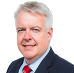
Carwyn Jones AC Llafur Cymru Pen-y-bont ar Ogwr