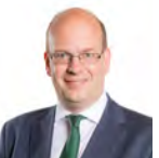
Mark Reckless AC