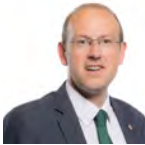
Llyr Gruffydd AC