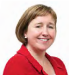
Lynne Neagle AC