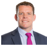
Rhun ap Iorwerth AC Plaid Cymru