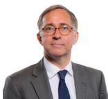
David Melding AC Ceidwadwyr Cymreig

Mynychodd yr Aelod a ganlyn fel dirprwy yn ystod yr ymchwiliad hwn.