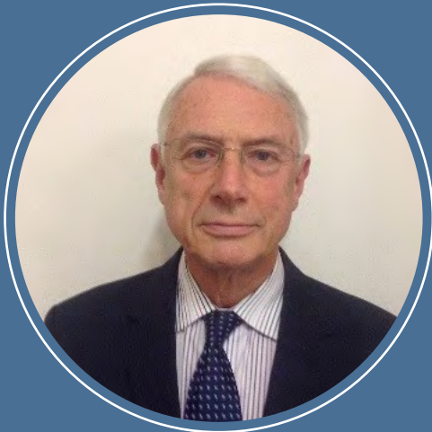
Syr Roderick Evans Comisiynydd Safonau

Prif gyfrifoldebau'r Comisiynydd Safonau yw cael cwynion am ymddygiad Aelodau'r Cynulliad ac ymchwilio iddynt, cyflwyno adroddiadau i'r Cynulliad am ei ymchwiliadau a rhoi cyngor i Aelodau'r Cynulliad a'r cyhoedd am y weithdrefn gwyno.