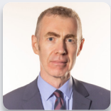
Adam Price AS Plaid Cymru