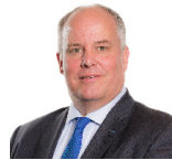
Andrew RT Davies AS Ceidwadwyr Cymreig