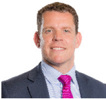
Rhun ap Iorwerth AS Plaid Cymru