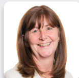
Lesley Griffiths AS Llafur Cymru