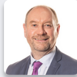
Cefin Campbell AS Plaid Cymru