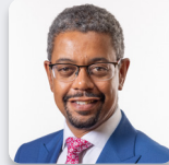
Vaughan Gething AS Llafur Cymru