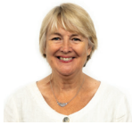
Siân Gwenllian AC Plaid Cymru