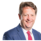
Alun Davies AC Llafur Cymru