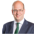
Mark Reckless AC Plaid Brexit