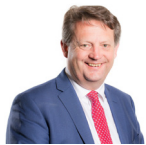
Alun Davies AC Llafur Cymru