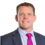
Rhun ap Iorwerth AC Plaid Cymru

Roedd yr Aelod a ganlyn hefyd yn aelod o'r Pwyllgor yn ystod yr ymchwiliad hwn.