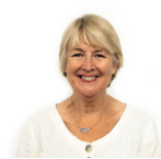
Siân Gwenllian AC Plaid Cymru