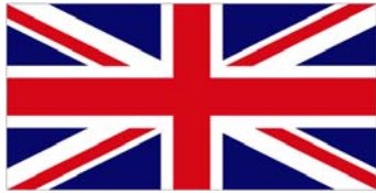
Y Deyrnas Unedig

Rhowch y gwledydd canlynol mewn trefn, yn ôl pa wledydd y credwch a roddodd bleidlais i ferched gyntaf: