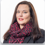
Cadeirydd y Pwyllgor: Vikki Howells AS Llafur Cymru