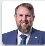
Peredur Owen Griffiths AS Plaid Cymru