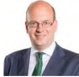
Mark Reckless AC UKIP Cymru Dwyrain De Cymru