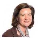
Eluned Morgan AC Llafur Cymru Canolbarth a Gorllewin Cymru