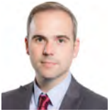
Steffan Lewis AC Plaid Cymru Dwyrain De Cymru