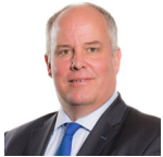
Andrew RT Davies AC Ceidwadwyr Cymreig Canol De Cymru