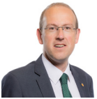
Llyr Gruffydd AC Plaid Cymru Gogledd Cymru