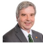
Dai Lloyd AC Plaid Cymru Gorllewin De Cymru