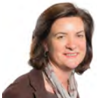
Eluned Morgan AC Llafur Cymru Canolbarth a Gorllewin Cymru