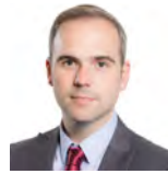
Steffan Lewis AC Plaid Cymru Dwyrain De Cymru