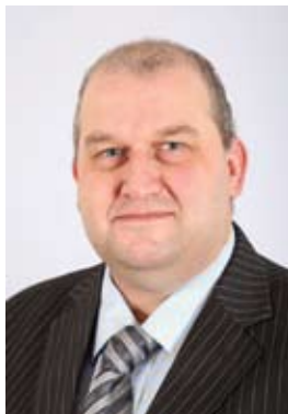
Carl Sargeant AC

Bydd llawer o'r gwaith a nodwyd yn y Trydydd Dimensiwn yn dwyn ffrwyth yn y cyfnod a ddisgrifir yn adroddiad y flwyddyn nesaf. Edrychaf ymlaen at flwyddyn arall o weithio'n llwyddiannus mewn partneriaeth rhwng Llywodraeth y Cynulliad a'r Trydydd Sector.