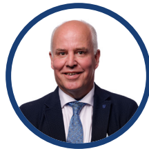
Andrew RT Davies

Y Ceidwadwyr Cymreig Welsh Conservatives