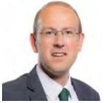
Llyr Gruffydd AC Plaid Cymru Gogledd Cymru