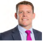
Rhun ap Iorwerth AC Plaid Cymru Ynys Mon