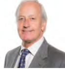
Neil Hamilton AC UKIP Cymru Canolbarth a Gorllewin Cymru