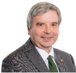
Dai Lloyd AS Plaid Cymru