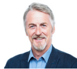
Huw Irranca-Davies AS Llafur Cymru