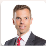
Ken Skates AS Llafur Cymru