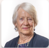
Cadeirydd y Pwyllgor: Jenny Rathbone AS Llafur Cymru