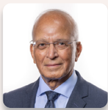
Altaf Hussain AS Ceidwadwyr Cymreig