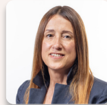
Jane Dodds AS Democratiaid Rhyddfrydol Cymru