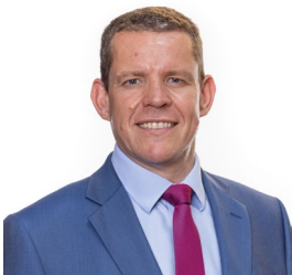
Rhun ap Iorwerth AS

O ran ein cynlluniau ar gyfer y flwyddyn sydd i ddod, byddwn yn edrych ar y gefnogaeth sydd ar gael i Aelodau o'r Senedd i'w galluogi i gyfrannu yn eu dewis iaith, ac i fod yn hyderus wrth wneud hynny mewn trafodion neu yn eu hetholaeth. Byddwn hefyd yn ystyried ein prosesau cynllunio ieithyddol gan edrych ar gynlluniau iaith y gwasanaethau unigol a chasglu gwybodaeth am sgiliau iaith Staff y Comisiwn. Bydd hyn oll yn rhoi sicrwydd ynghylch lefelau sgiliau a chapasiti i ddarparu gwasanaethau o'r radd flaenaf.