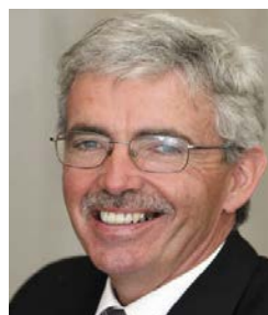
Peter Davies CBE Cadeirydd

Mae pobl yn cymryd rhan yn y Trydydd Sector am fod achosion penodol yn eu cymunedau yn bwysig iawn iddynt. O gofio amseroedd cynyddol ansicr ein dydd, nid yw'r ddeialog barhaus rhwng Llywodraeth Cymru a'r Trydydd Sector yng Nghymru, na'r berthynas sy'n datblygu rhyngddynt, erioed wedi bod yn bwysicach.