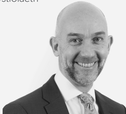
Adrian Crompton Archwilydd Cyffredinol Cymru

Mae'n dal i fod yn hanfodol bod Llywodraeth Cymru'n rhoi gwersi o'r prosiect hwn ar waith wrth iddi gyflawni cynlluniau yn y dyfodol, ac un prawf o hynny fydd effaith newidiadau a wnaed yn barod i'w threfniadau contractio. Ac er bod y gweithgarwch adeiladu wedi dod i ben i raddau helaeth, mae gan Lywodraeth Cymru waith i'w wneud o hyd i adrodd yn fwy llawn ar fanteision y prosiect, gan adeiladu ar y dystiolaeth hyd yma.