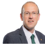
Llyr Gruffydd AS Plaid Cymru