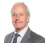
Neil Hamilton AS UKIP Cymru