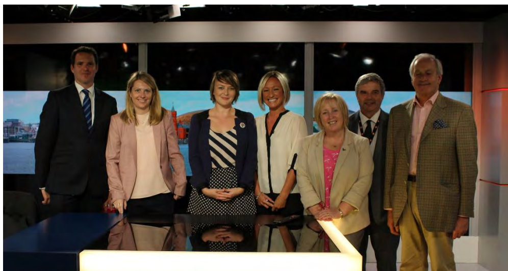
Ymweliad y Pwyllgor i ITV Studios, Medi 2016

"All the evidence in terms of viewing figures, in terms of audience appreciation, has shown that we are getting that balance (of spend and creative and commercial output) right. So, it's not simply about the amount that you're spending."