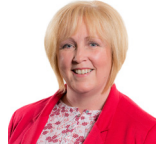
Suzy Davies AC Ceidwadwyr Cymreig Gorllewin De Cymru