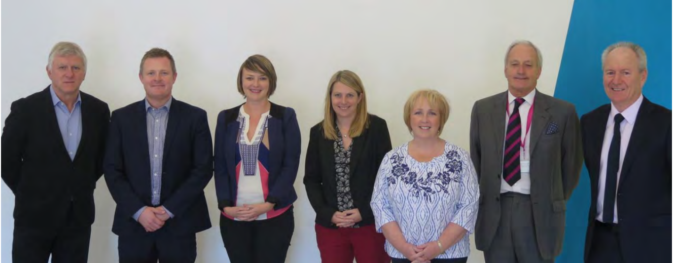
Ymweliad y Pwyllgor i S4C Studios, Medi 2016