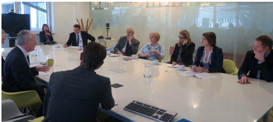
Ymweliad y Pwyllgor i S4C Studios, Medi 2016

“We welcome the clear references to S4C in the framework agreement and the charter documentation, because they clearly commit to the independence of S4C and they give a clear recognition of funding for the next five years.”