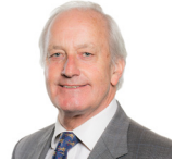
Neil Hamilton AC UKIP Cymru Canolbarth a Gorllewin Cymru