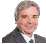
Dai Lloyd AC Plaid Cymru Gorllewin De Cymru