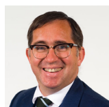
David Melding Canol De Cymru Plaid Geidwadol Cymru