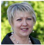
Eleanor Burnham Gogledd Cymru Democratiaid Rhyddfrydol Cymru