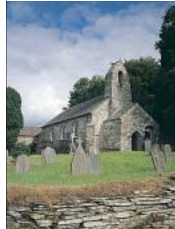
Uchod: Eglwys Manordeifi.

Ymwelodd aelodau'r Cyngor yn ystod 2000 i asesu a oedd adeilad Manordeifi o safon a fyddai'n gymwys i'w freinio i ofal y cyfeillion a daethant i'r casgliad fod swyn a symrwydd yr adeilad a'i fynwent, ynghyd a'r ddiddordeb hanesyddol sylweddol, yn ei osod yn y categori eithriadol, ac felly yn gymwys i'w freinio. Mae'r adeilad bellach yng ngofal y Cyfeillion a chafodd y gwaith atgyweirio drwy gymorth grant gan Cadw a'r Eglwys yng Nghymru, ei gwblhau'n effeithiol iawn. Heb gymorth, byddai adeilad hanesyddol gwych o'r fath wedi bod mewn perygl o fynd yn adfail a chael ei golli.