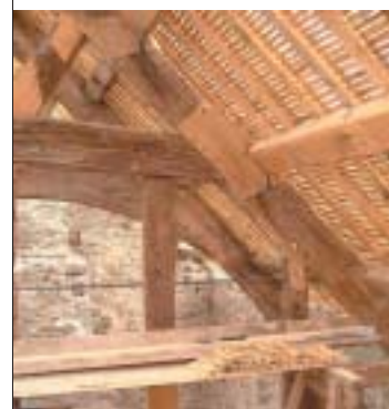
Top: Cadwyd y trawstiau gwreiddiol lle y bo'n bosibl (Landmark Trust).