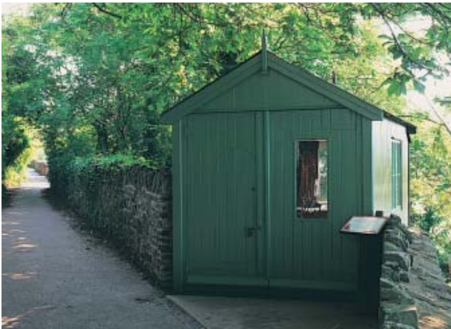
Chwith: Sied ysgrifennu Dylan Thomas, Talacharn, Sir Gaerfyrddin.

* Cynlluniau y mae'r Cyngor wedi argymhell rhoi grant iddynt ond yn dibynnu ar amodau, megis cytuno ar gynllun addas o atgyweiriadau, cyn penderfynu ar lefel y grant.