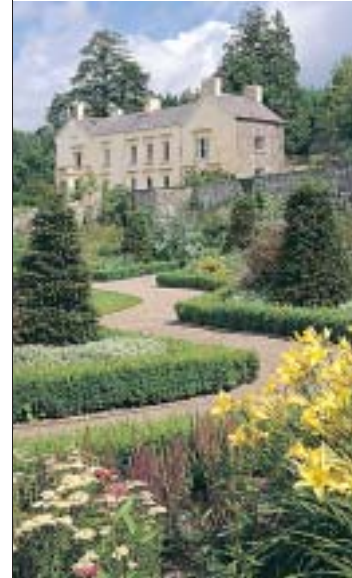
Uchod: Aberglasne: y tŷ a'r ardd.