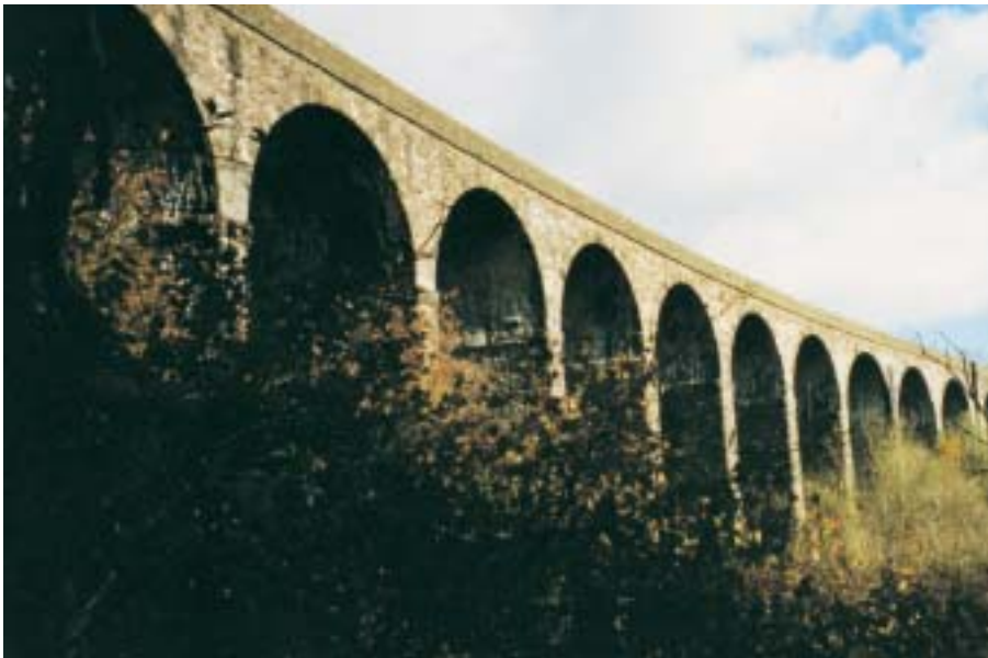
Chwith: Traphont Hengoed, Maes y cymmer.

Cyflwynwyd ceisiadau ar gyfer pob math o adeiladau gan unigolion preifat, sefydliadau elusennol a sefydliadau eraill ac awdurdodau lleol. Nodir ceisiadau neilltuol y flwyddyn yn yr astudiaethau achos canlynol: