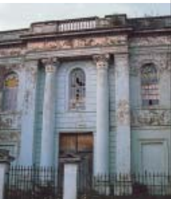
Uchod: Capel Glendower Street mewn cyflwr adfeiliedig (Anthony Jones).

Fe'n trawyd gan y trawsnewid i gyn gapel yr Annibynwyr yn Glendower Street, Trefynwy, at ddefnydd preswyl. Capel Fictoraidd cynnar oedd hwn yn yr arddul glasurol gydag wyneb tri phorth a dau biler maint llawn bob ochr. Fe'i adeiladwyd yn ystod y 1840au a chafodd ei gau ar ôl ei wasanaeth olaf yn 1953. Daeth yr adeilad gerbron y Cyngor ym mis Ebrill 2000 a chafodd ei asesu i fod o ddiddordeb eithriadol er gwaethaf ei gyflwr gwael ac roeddem yn falch o argymhell cymorth grant. Dair blynedd yn ddiweddarach, mae'r hen gapel yn cael ei ddefnyddio fel cartref teuluol. Mae'r gwaith ar yr ochr allanol adfeiliedig wedi gwella ymddangosiad yr adeilad yn fawr yn ogystal ag edrychiad y stryd mewn ardal gadwraeth y mae'n rhan fawr ohoni. Caiff uchder mewnol gwreiddiol y capel ei gadw ac mae'r oriel wedi cael ei hailffurfio yn