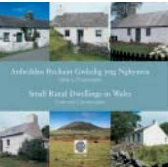
Uchod: Anheddau Bychain Gwledig yng Nghymru.

Dros ddegawdau ei fodolaeth esblygodd dealltwriaeth y Cyngor o'r hyn sy'n cynrychioli hanfodion amgylchedd hanesyddol y wlad, gyda mwy o bwyslais yn ddiweddar ar bwysigrwydd adeiladau gwledig a esgeuluswyd. Mae'r hen farn nad oedd gan Gymru ei phensaernïaeth draddodiadol ei hun wedi cael ei disodli gan werthfawrogiad o enghreifftiau rhyfeddol o saernïaeth anghofiedig a thechnegau strwythurol a drosglwyddwyd o un genhedlaeth i'r llall dros y canrifoedd. Bu'r Cyngor yn falch o argymhell grant ar gyfer sawl un o'r cyfryw adeiladau fel enghreifftiau prin o draddodiadau adeiladu. Roedd ein hadroddiad ar gyfer 2001–02 yn cynnwys sawl enghraifft a hefyd yn cynnwys ein hymweliad â Phen Llŷn lle y gwelsom sawl bwthyn gan ystyried eu pwysigrwydd o fewn hanes cymdeithasol Cymru. Roeddem o'r farn bod eu parhad o arwyddocâd arbennig ac argymhellwyd i Cadw y dylai hyn gael ei gofnodi, o bosibl mewn cyhoeddiad. Felly roeddem yn falch bod Cadw wedi ymateb i'n cyngor ac wedi lansio llyfryn ym mis Mawrth ar ofal a chadwraeth anheddau bach gwledig. Rydym yn llongyfarch Cadw ar gyflwyniad a chynnwys yr arweiniad hwn a gobeithio y bydd yn gweithredu fel modd o dynnu sylw at yr adeiladau dinod ond hanesyddol bwysig hyn ac y bydd o gymorth i'w diogelu.