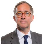
David Melding AC Ceidwadwyr Cymreig Canol De Cymru

Roedd yr Aelodau a ganlyn hefyd yn aelodau o'r Pwyllgor yn ystod yr ymchwiliad hwn.