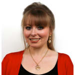
Delyth Jewell AC Plaid Cymru Dwyrain De Cymru