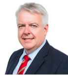
Carwyn Jones AC Llafur Cymru Pen-y-bont ar Ogwr