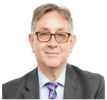
Mick Antoniw AC Llafur Cymru Pontypridd