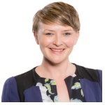
Bethan Sayed AC Plaid Cymru Gorllewin De Cymru