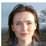
Kirsty Williams Brycheiniog a Sir Faesyfed Democratiaid Rhyddfrydol Cymru