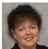
Lorraine Barrett De Caerdydd a Phenarth Llafur