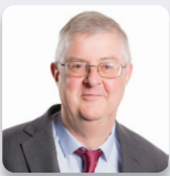
Mark Drakeford AS Llafur Cymru