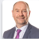
Cefin Campbell AS Plaid Cymru