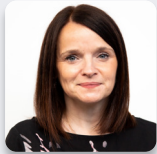
Cadeirydd y Pwyllgor: Buffy Williams AS Llafur Cymru