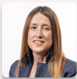
Jane Dodds AS Democratiaid Rhyddfrydol Cymru