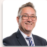
Mick Antoniw AS Llafur Cymru