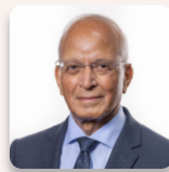
Altaf Hussain AS Ceidwadwyr Cymreig