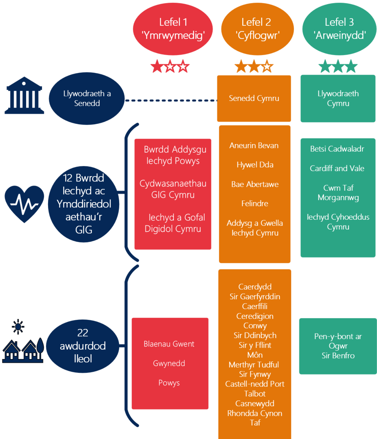
Ffigur 4 ciplwng ar gyrff y sector cyhoeddus a'u lefelau perthnasol o achredu Hyderus o ran Anabledd 76