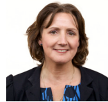
Janet Finch-Saunders AC Ceidwadwyr Cymreig