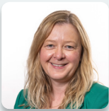
Jayne Bryant AS Llafur Cymru