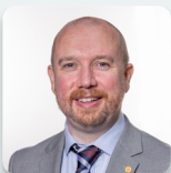
Mabon ap Gwynfor AS Plaid Cymru

Roedd yr Aelod a ganlyn hefyd yn aelod o'r Pwyllgor yn ystod yr ymchwiliad hwn.