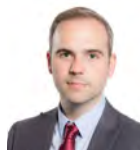
Steffan Lewis AC Plaid Cymru Dwyrain De Cymru