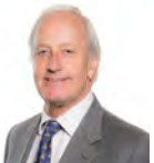
Neil Hamilton AC UKIP Cymru Canolbarth a Gorllewin Cymru