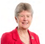
Jane Hutt AC Llafur Cymru Bro Morgannwg