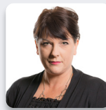
Rhianon Passmore AS Llafur Cymru