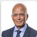
Altaf Hussain AS Ceidwadwyr Cymreig

Mynychodd yr Aelod a ganlyn fel dirprwy yn ystod yr ymchwiliad hwn: