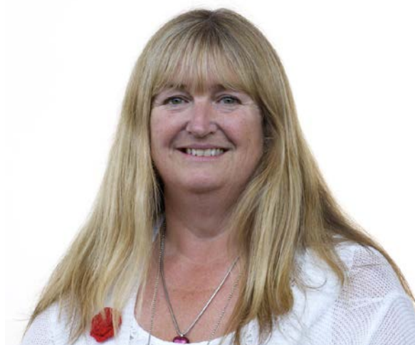
Julie James AC Y Gweinidog Tai a Llywodraeth Leol

Fel Llywodraeth, rydym wedi ymrwymo o hyd i ddarparu gwasanaethau a chefnogaeth ar gyfer y gymuned hon, a byddwn yn parhau i weithio mewn partneriaeth ar draws y sectorau hyn i sicrhau bod y gymuned hon yn cael y gefnogaeth honno.