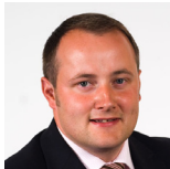
Darren Millar (Cadeirydd) Clwyd West Plaid Geidwadol Cymru