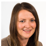
Bethan Jenkins Gorllewin De Cymru Plaid Cymru