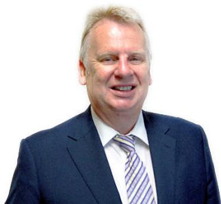
Rhodri Glyn Thomas AC

Mae'r Adroddiad Cydymffurfio Blynyddol hwn yn dathlu'r ffaith ein bod wedi trawsnewid y ffordd rydym yn darparu gwasanaethau dwyieithog. Bydd y diwylliant ac ethos dwyieithog sydd wedi dod yn rhan annatod ar draws y sefydliad yn golygu y byddwn yn edrych yn barhaus am ffyrdd o wella. Edrychaf ymlaen at weld enw da Cynulliad Cenedlaethol Cymru fel sefydliad gwirioneddol ddwyieithog yn esblygu ac yn ffynnu yn y blynyddoedd i ddod.