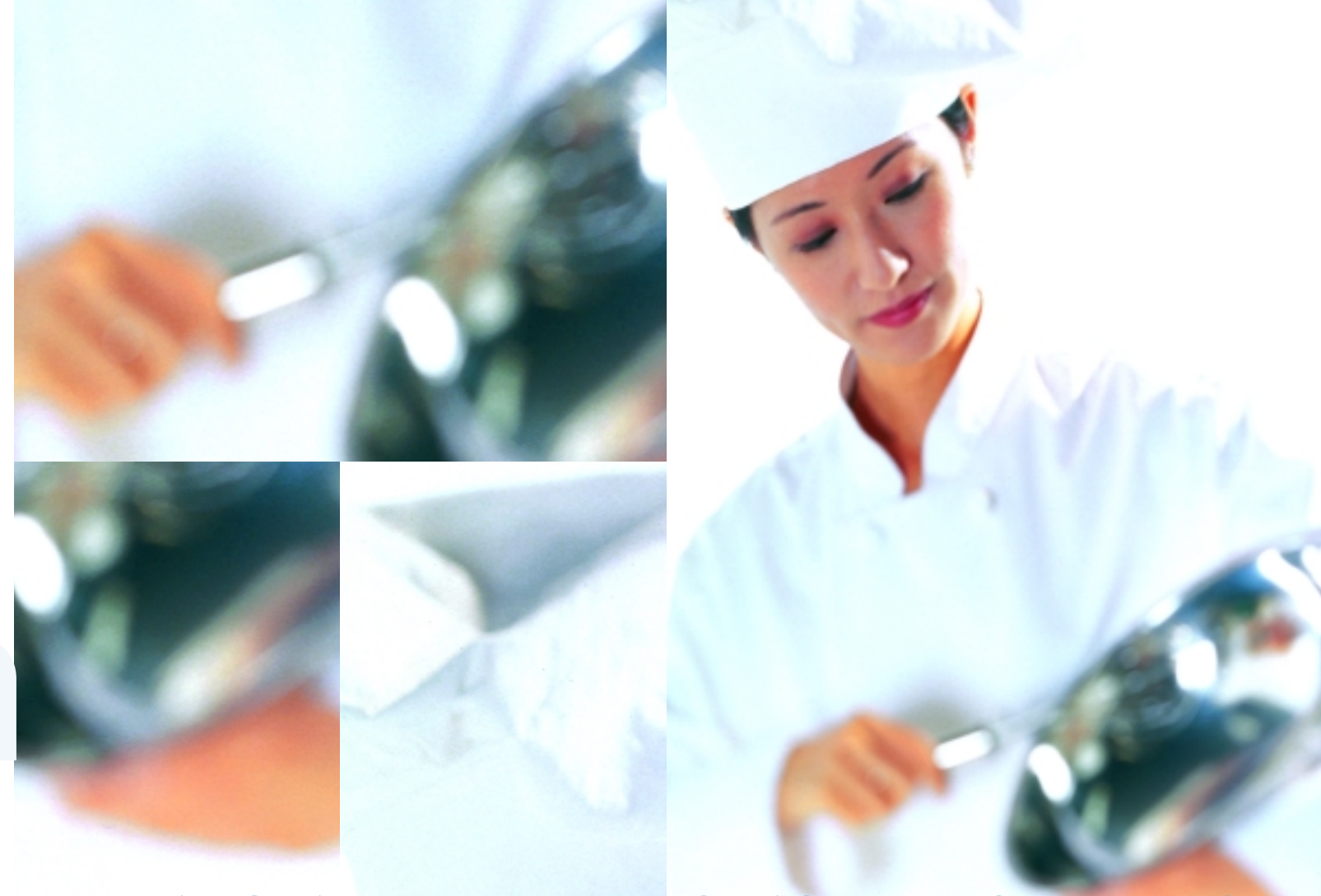
DULLIAU GWAITH MWY EFFEITHLON AC EFFEITHIOL EFFEITHLON