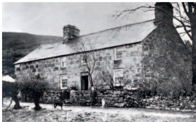
Clocwedd o'r prif lun: Cadair farddol Hedd Wyn ar ôl ei farwolaeth, a ddyfarnwyd am ei gerdd Yr Arwr ym 1917; Yr Ysgwrn, ar ddechrau'r 20fed ganrif, Hedd Wyn