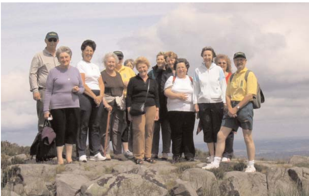
Grŵp Cerdded Llwybr Iechyd Torfaen

Rydym wedi cyflwyno newid sylfaenol yn y ffordd yr ydym yn cynllunio ein gwaith. Daw ein holl waith dan adain un o blith pump o benawdau cyffredinol, neu 'themâu', sy'n ffurfio penodau'r adroddiad hwn. Mae pump o 'grwpiau thema' wedi cael eu sefydlu, ac mae'r rhain yn trafod blaenoriaethau'r holl sefydliad yn hytrach na'u trafod o fewn gwahanol rannau yn strwythur y sefydliad. Y canlyniad yw bod modd i ni gynllunio ein gwaith mewn ffordd fwy integredig, a hefyd gallwn gyfathrebu'n well gyda'n gilydd o ran datblygu ein cynlluniau ar gyfer cael canlyniadau gwell. Daeth cryn dipyn o broblemau i'n rhan yn ystod y flwyddyn gyntaf wrth weithio yn y ffordd yma, ond byddwn yn dysgu yn sgîl y rhain, ac rydym yn hyderus fod gennym sylfaen ar gyfer cael ffordd fwy cynhwysol a chlr o gyflawni ein hamcanion.