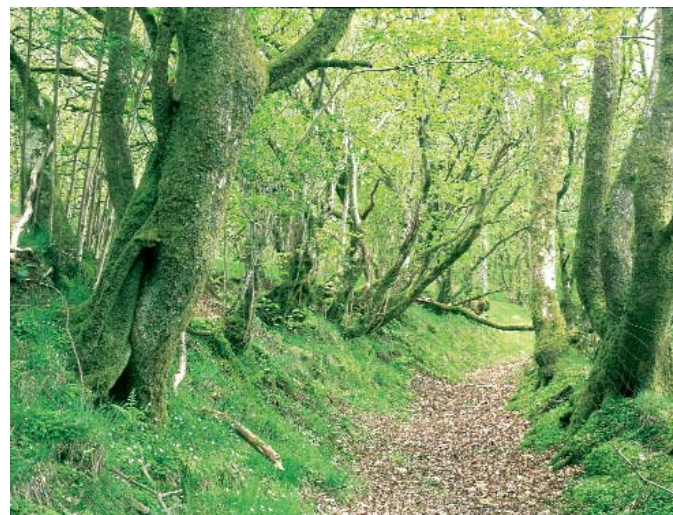
Gwarchodfa Natur Genedlaethol Allt Rhyd y Groes - David Woodfall

Wrth gwrs, mae dynodi safleoedd sydd o bwysigrwydd arbennig oherwydd eu bywyd gwyllt a'u daeareg yn Safleoedd o Ddiddordeb Gwyddonol Arbennig (SoDdGA) yn gam hollbwysig tuag at eu diogelu, ond nid dyma yw diwedd y stori. Maent angen eu rheoli mewn dull cadarnhaol ac mewn ffordd sy'n bur wahanol i'r arferion ffermio a'r arferion coedwigaeth y mae eu perchnogion a'u rheolwyr yn dymuno'u defnyddio. Mae dod i gytundeb sy'n arwain at allu defnyddio dulliau cadwraethol cadarnhaol ar SoDdGA wedi bod yn destun targed uchelgeisiol iawn ar gyfer eleni – sef sicrhau bod 5,000 o hectarau yn fwy o dir SoDdGA yn cael eu rheoli'n sympathetig. Rydym wedi