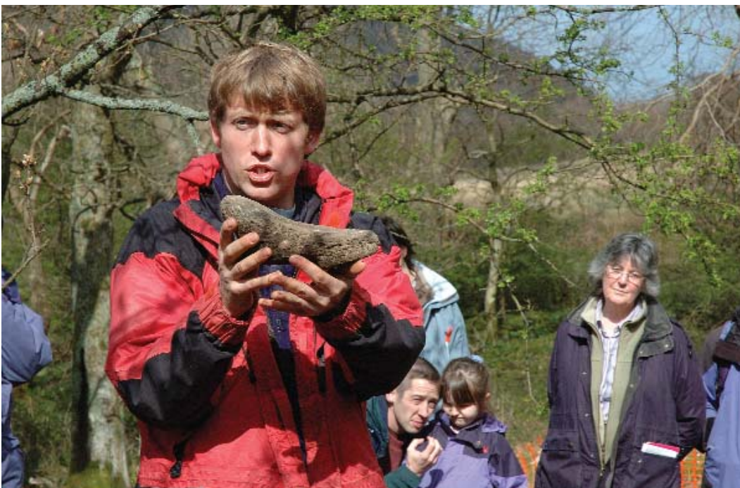
Darn o felin law a ddarganfuddwyd yng Nghoedydd Aber, Prosiect archaeolegol cymunedol Aber

Mae wedi bod yn bleser gennym gefnogi prosiect archeolegol cymunedol sydd wedi denu amryw o fyfyrwyr a gwirfoddolwyr dan arweiniad archeolegwyr proffesiynol i gloddio dwy o siambrau claddu o'r Oes Efydd a leolir yng nghysgod rhaeadr boblogaidd Aber. Mae'r gwaith yn cyfrannu at brosiect ehangach sy'n gwella ein dealltwriaeth o sut y mae'r tirlun diwylliannol wedi esblygu. Gwelir bod trigolion lleol yn cymryd rhan yn y gwaith hwn ar bob lefel, gan gynnwys prosiect i gofnodi atgofion plentyndod preswylwyr hŷn. Yn y pen draw, fe fydd yr holl waith sydd ynghlwm wrth gasglu gwybodaeth yn dod yn rhan o archif a fydd ar gael i'r cyhoedd mewn sawl ffurf. Ffordd bwysig y gellir gweld yr archif yw ar