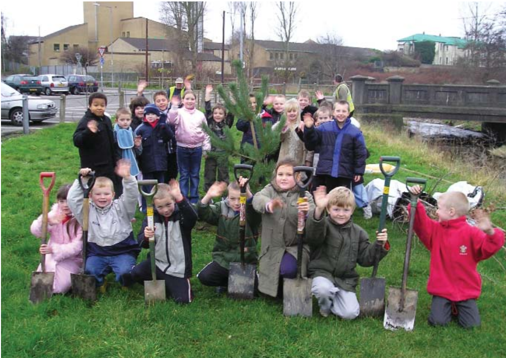
Prosiect Afon Lliedi sy'n brosiect i'r gymuned gyfan, yn cynnwys Prosiect Iechyd a Lles Ysgol Gynradd Penygaer

grwpiau cymunedol a sefydliadau lleol eraill – er mwyn bwrw ymlaen â'r dyheadau hyn. Gwelir bod y grŵp wedi nodi cyfres o safleoedd o'r fath, gyda phob un yn eiddo i'r cyhoedd, gan gynnwys chwareli helaeth neu safleoedd diwydiannol, llwybrau glannau afon, rhandiroedd, lawntiau ysgolion, mynwent, cartref henoed a lleiniau bychain bach o dir.