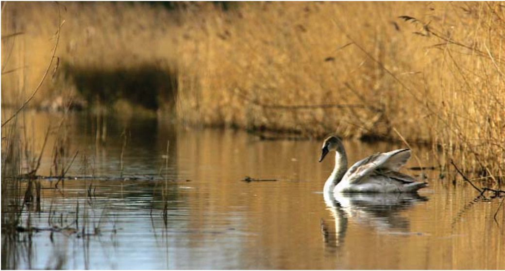
(ac isod) Gwarchodfa Glwyptiroedd Casnewydd

hwyaid sy'n gaeafu yma – gan gynnwys chwiwellod, hwyaid llosthain, hwyaid llydanbig, hwyaid copog a hwyaid llwydion – yn ogystal ag adar y bwn (bron i gant ohonynt), a chrëyr glas prin yn y corsleoedd.