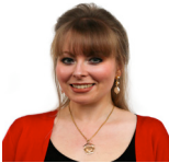
Delyth Jewell AC Plaid Cymru