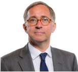
David Melding AC Ceidwadwyr Cymreig

Roedd yr Aelodau a ganlyn hefyd yn aelodau o'r Pwyllgor yn ystod yr ymchwiliad hwn.