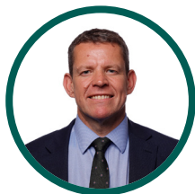
Rhun ap Iorwerth

You can contact any of them, no matter who you voted for.